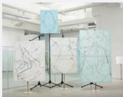
右:「地域アートプロジェクト報告展(磯部湯活用プロジェクト)」(アーツ前橋、2014)

http://www.takaishiiigallery.com/jp/archives/4908/