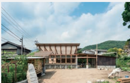
(Umaki Camp)2013