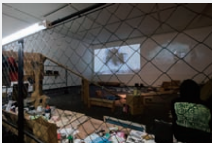
左:展示風景「風穴 もうひとつのコンセプトアリズム、アジアから」(国立国際美術館、2011)