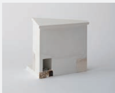
左:《豆腐と油揚げ》2013 右:《本立て》吉田泉殿町2015