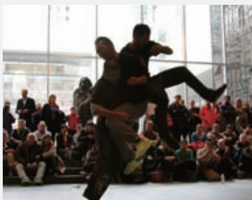
右:パフォーマンス風景「Performing Histories: Live Artwork Examining the Past at The Museum of Modern Art, New York」(ニューヨーク近代美術館、2013)