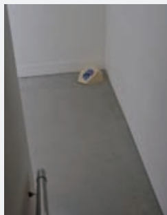
左:(2014年9月9日 浜離宮恩賜庭園 外堀)2015

本展では、都市における空間・想像・リアリティの新たな可能性について、アート、生活工芸、建築、身体表現など、多様な文脈と表現手段で発信を続ける伊藤存、contact Gonzo、志賀理江子、dot architects、中村裕太の作品やプロジェクトを紹介し、彼らの視線は、見慣れたはずの都市空間に埋もれる価値観や感情、景色や匂い、矛盾と神話を露にし、社会や人間の凹凸や輪郭を刺激的にかき混ぜます。「裏返しに、くまなく」を意味する副詞「inside out」をキーワードとし、5組の作家たちの作品を通して、私たちの記憶や意識、他者との繋がり、場との関係性について再考を試みます。