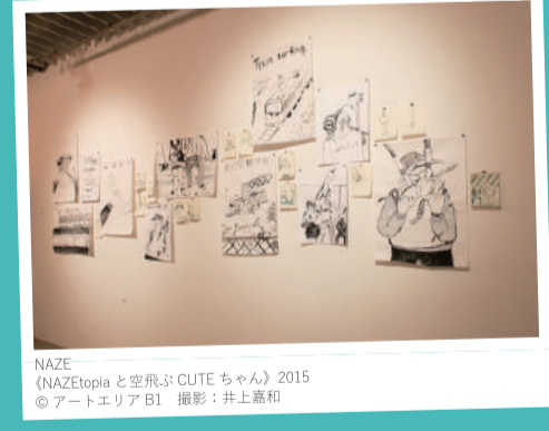
NAZE 《NAZEtopiaと空飛ぶCUTEちゃん》2015 ©アートエリアB1 撮影：井上嘉和