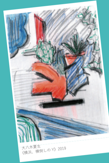
大八木夏生 《横浜、横倒しのY》2019