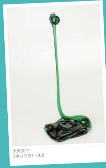
大東真也 《魂の行方》2018