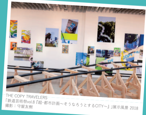
THE COPY TRAVELERS 「鉄道芸術祭vol.8『超・都市計画〜そうなるうとするCITY〜』」展示風景 2018