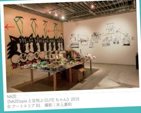
NAZE 《NAZEtopiaと空飛ぶCUTEちゃん》2015