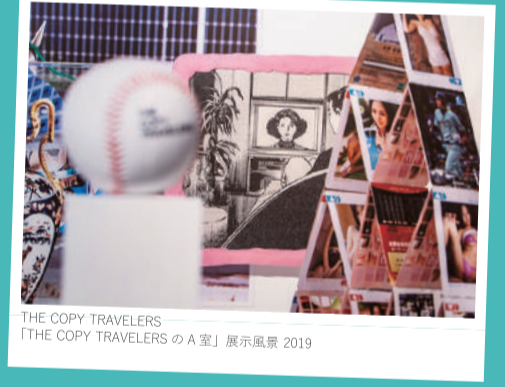
THE COPY TRAVELERS 「THE COPY TRAVELERSのA室」展示風景 2019