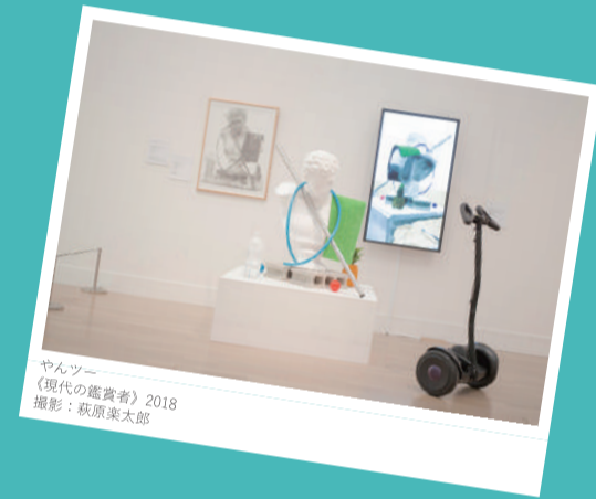
やんツー 《現代の鑑賞者》2018