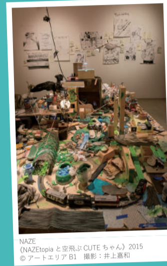
NAZE 《NAZEtopiaと空飛ぶCUTEちゃん》2015