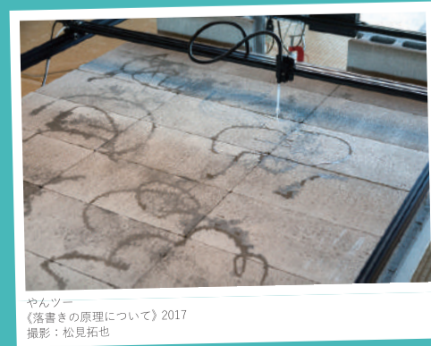
やんツー 《落書きの原理について》2017