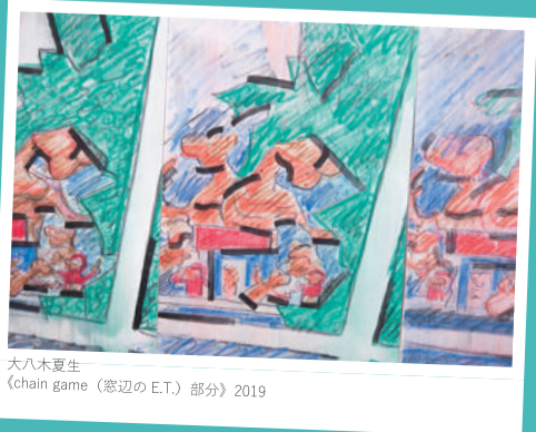
大八木夏生 《chain game (窓辺のE.T.) 部分》2019