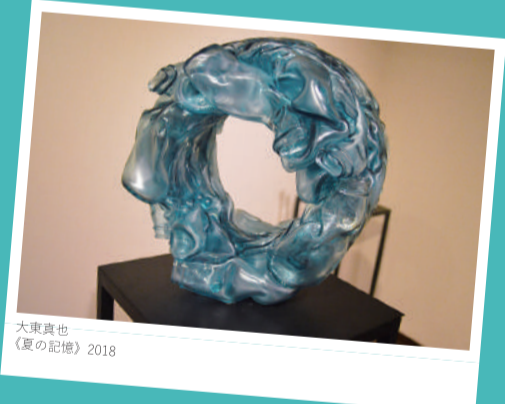
大東真也 《夏の記憶》2018