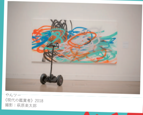
やんツー 《現代の鑑賞者》2018 撮影：萩原実太郎