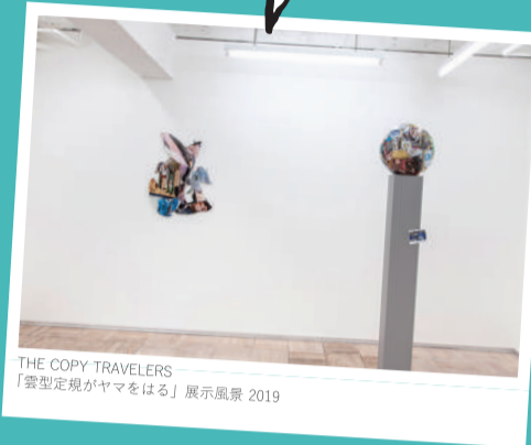
THE COPY TRAVELERS 「雲型定規がヤマをはる」展示風景 2019

1984年神奈川県生まれ。多摩美術大学大学院デザイン専攻情報デザイン研究領域修了。京都精華大学デザイン学部特任講師。近年の主な展覧会に「Art Meets 06 門馬美喜/やんツー」(アーツ前橋、群馬、2019)、「呼吸する地図たち」(山口情報芸術センター[YCAM]、山口、2018)、「DOMANI・明日展」(国立新美術館、東京、2018)など。