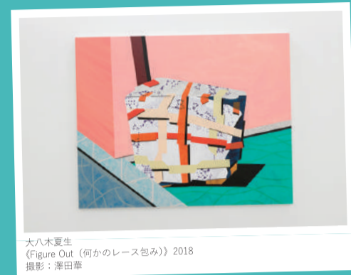
大八木夏生 《Figure Out (何かのレース包み)》2018