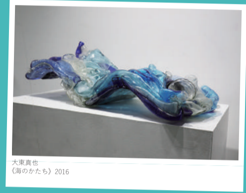
大東真也 《海のかたち》2016