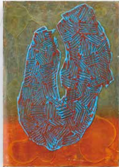
上:《山紫水明》2020 | oil on panel | 909 × 652 mm 下:《銀河に願いを》2019 | mixed media | 210 × 148 mm