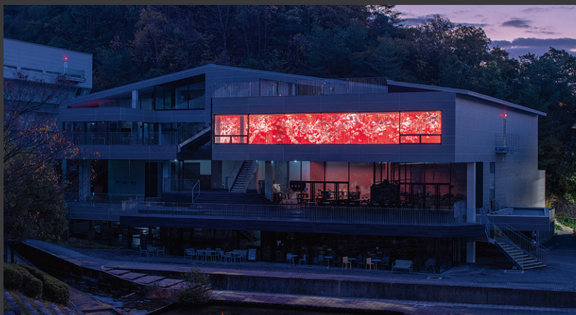
塩田千春《夢について》2023